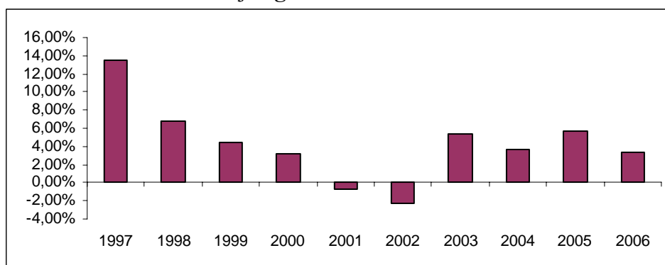
Evolução gráfica da rendibilidade

As rendibilidades divulgadas representam dados passados, não constituindo garantia de rendibilidade futura, porque o valor das unidades e participação pode aumentar ou diminuir em função do nível de risco que varia entre 1 (risco mínimo) e 6 (risco máximo).