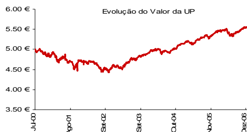
Evolução do Valor da Unidade de Participação