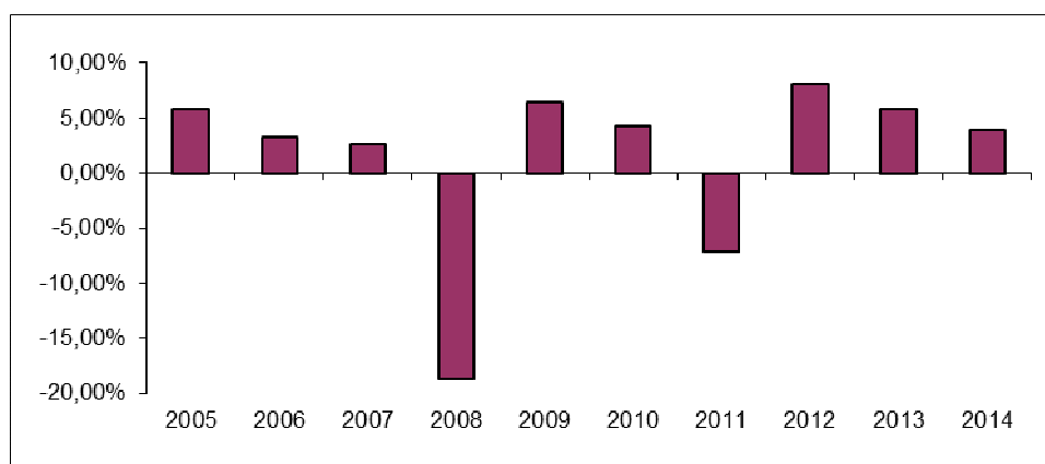
Evolução gráfica da rendibilidade