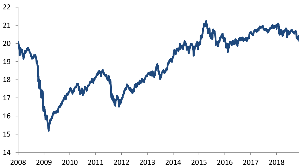
Evolução gráfica do valor da unidade de participação

As rendibilidades divulgadas representam dados passados, não constituindo garantia de rendibilidade futura, porque o valor das unidades e participação pode aumentar ou diminuir em função do nível de risco que varia entre 1 (risco mínimo) e 7 (risco máximo).