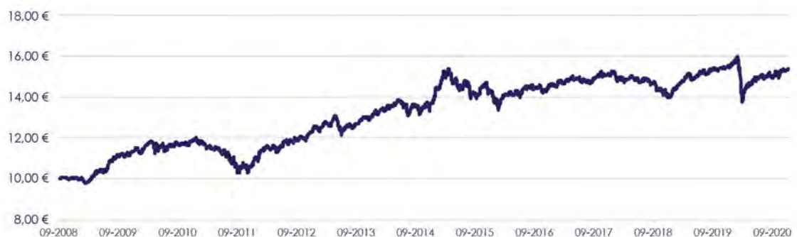
GRÁFICO DE EVOLUÇÃO COMPARADA DESDE INÍCIO DO FUNDO

O fundo não adota parâmetro de referência.